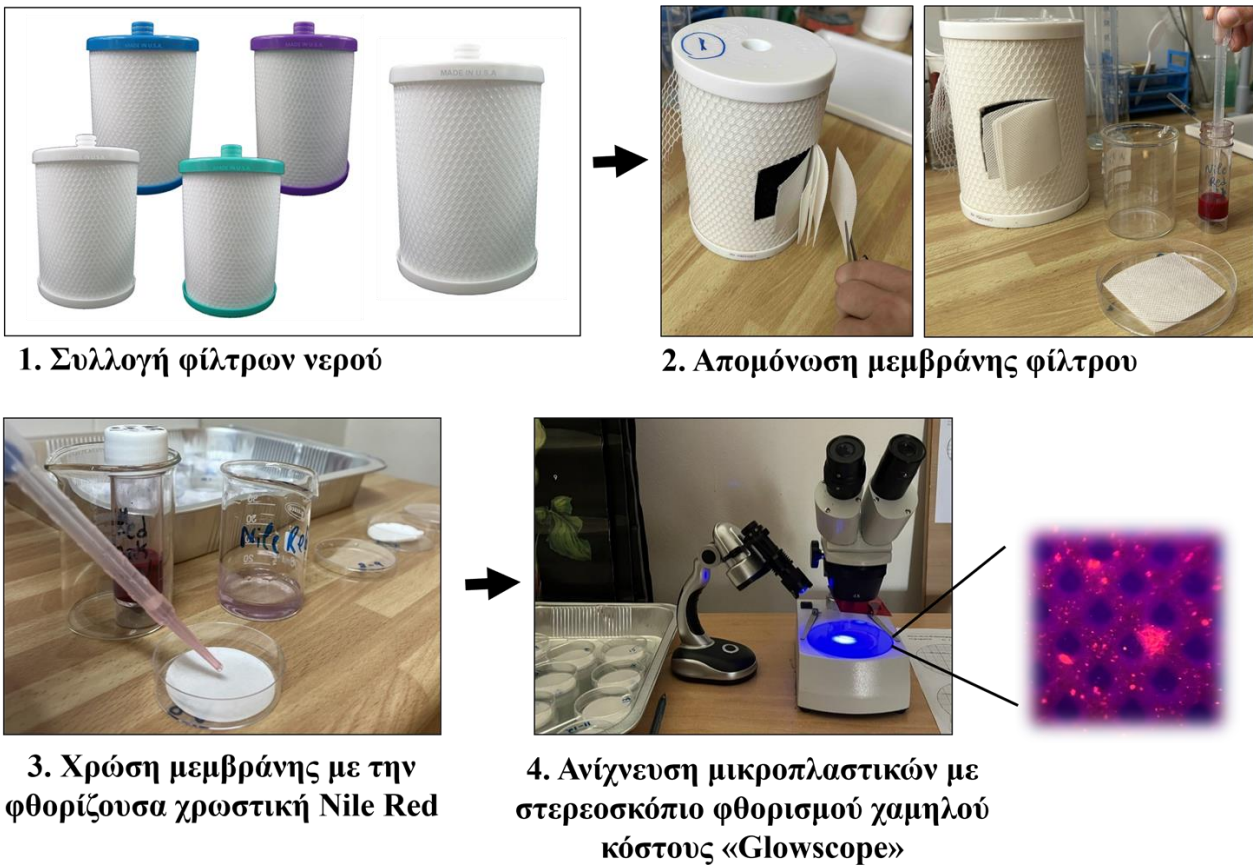
Εικόνα 1: Διάγραμμα μεθοδολογίας για ανίχνευση μικροπλαστικών σε φίλτρα πόσιμου νερού.

Για τη διεξαγωγή της έρευνας, αρχικά συλλέχθηκαν χρησιμοποιημένα φίλτρα νερού από μαθητές, καθηγητές καθώς και από εταιρείες φίλτρων νερού. Στη συνέχεια έγινε χρώση των μεμβρανών με ειδική φθορίζουσα χρωστική (Nile Red), η οποία έχει την ιδιότητα να προσκολλάται στα πλαστικά σωματίδια. Τέλος πραγματοποιήθηκε ανίχνευση φθορισμού με τη χρήση στερεοσκοπίου φθορισμού «Glowscope» το οποίο κατασκεύασε ομάδα μαθητών κάνοντας τροποποιήσεις στο απλό στερεοσκόπιο του εργαστηρίου βιολογίας. (Εικόνα 1). Τα δεδομένα που προέκυψαν καταγράφηκαν και αναλύθηκαν ώστε να εξαχθούν τα αντίστοιχα συμπεράσματα.